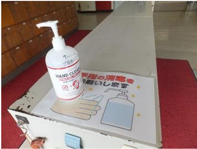
正面玄関(来校者用)